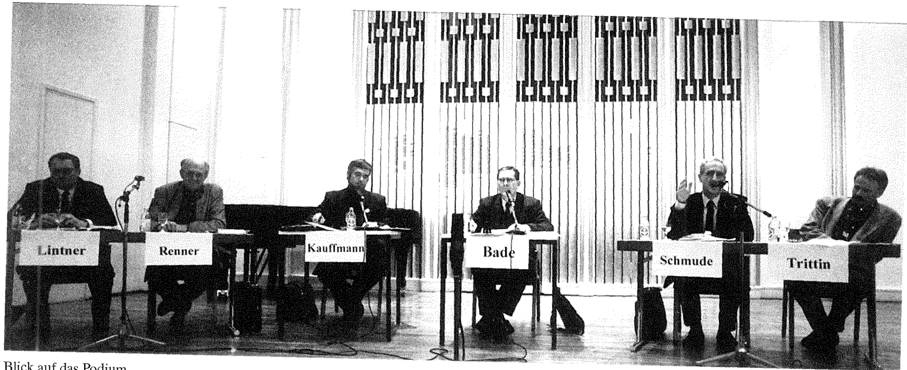
Blick auf das Podium