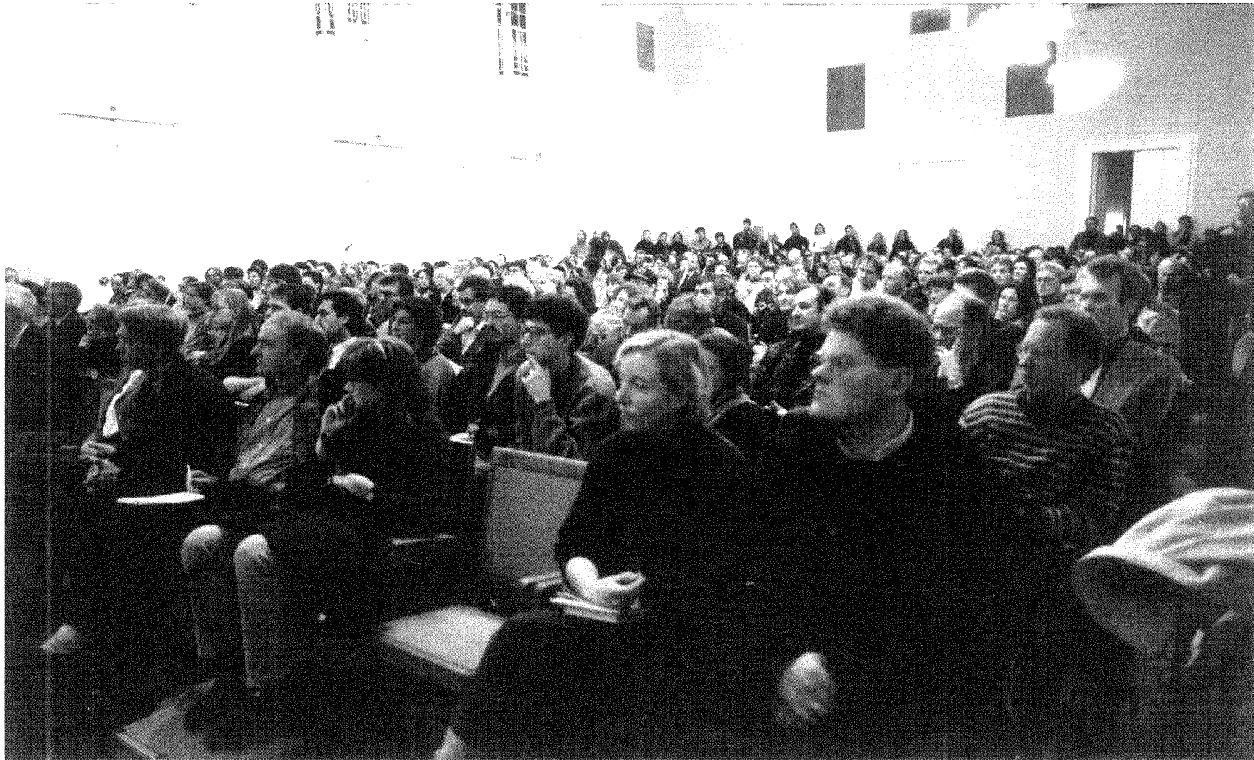
An die 400 Menschen verfolgten die Diskussion in der Schloßaula der Universität